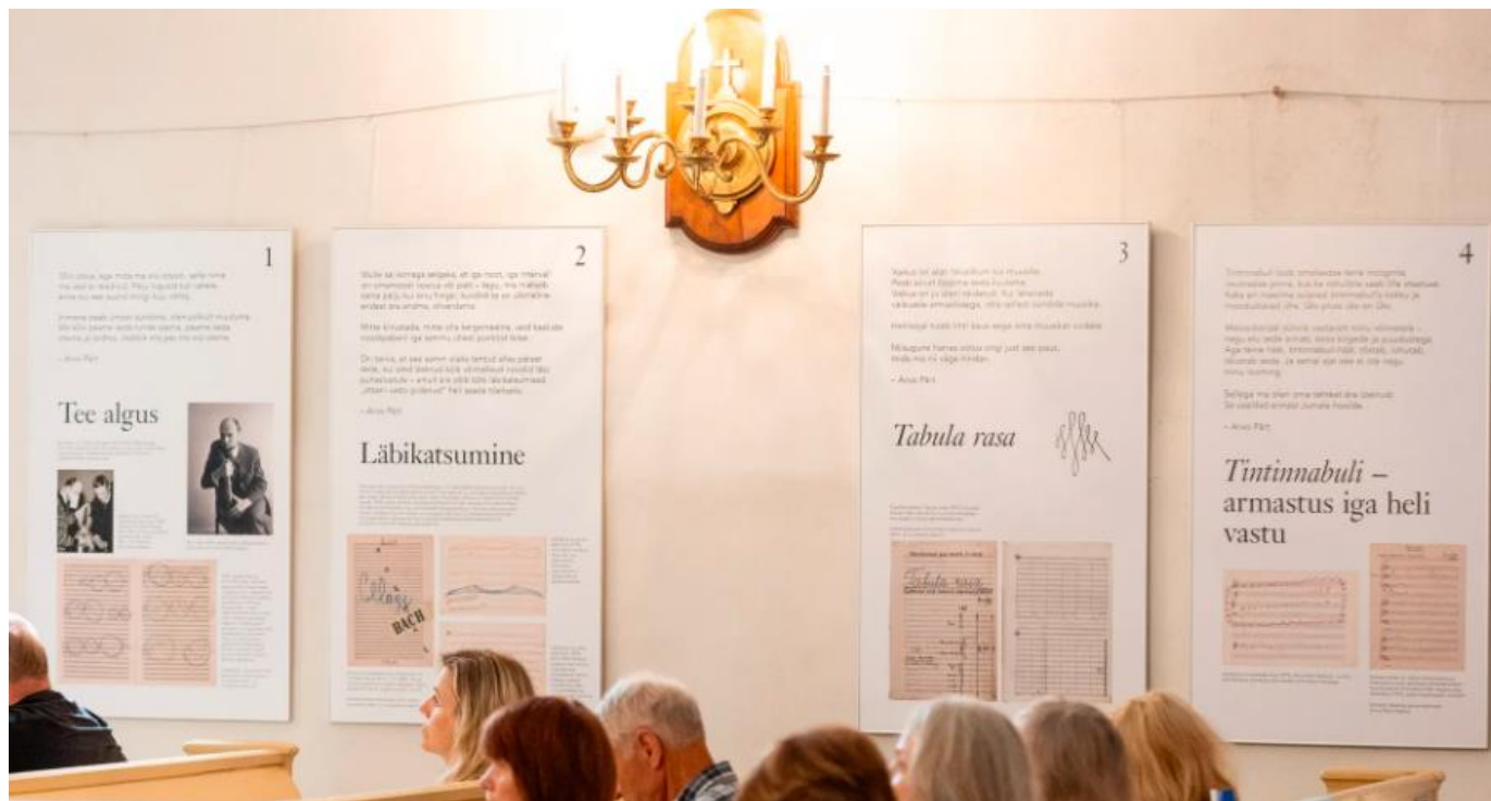
Arvo Pärdi elule ja loomingule pühendatud näituse avamine Paide kirikus