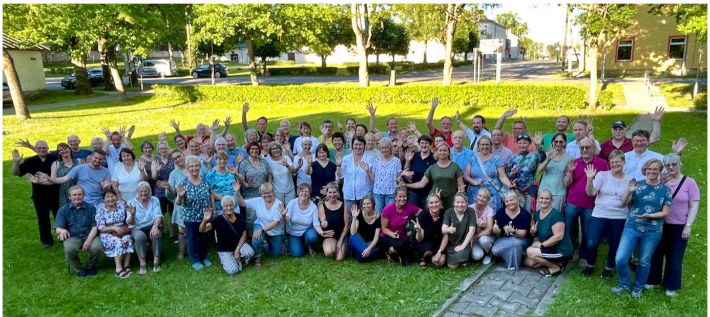
Saksa sõprade delegatsioon Hofgeismar-Wolfhagenist koos Järva praostkonna rahvaga