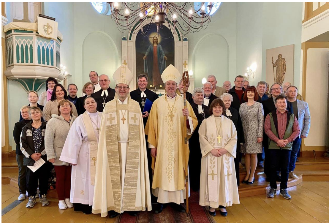
Järva praostkonna sinodist osavõtjad Tapa kirikus