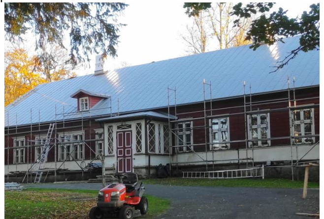
Katusevahetustööd Ambla pastoraadi juures