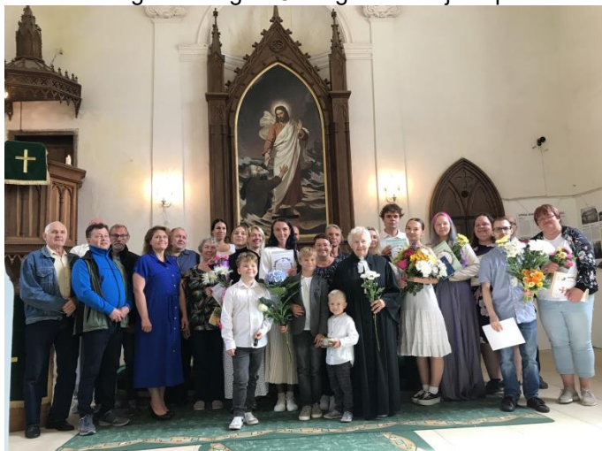
Õnnistamise päeval kirikus

Suvekuud olid väga õnnistus- ja töörohked. Juuli algul toimus Hinnovi suguvõsa kokkutuleku palvus kirikus. Suguvõsa on alguse saanud Anna kihelkonnast, paljud suguvõsa liikmed on maetud Anna kalmistule. Kokkutulekut peetakse tihti ning tavalisel alustatakse päeva Anna kirikus palvusega. Sellel aastal oli kõige kaugemalt kohale tulnud inimene Ameerika Ühendriikidest, kellele usaldati austav ülesanne tuua palvuse algul kirikusse sisse suguvõsa lipp ning teda assisteerisid kaks kõige nooremat suguvõsa liiget. Oli väga meeldejääv päev!