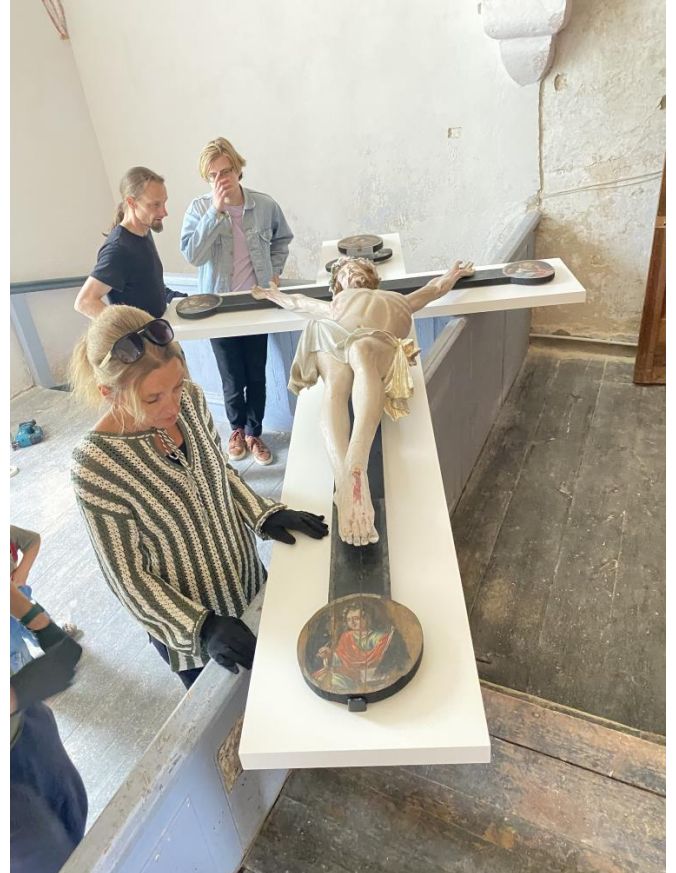
Koeru kiriku krutsifiks

Et asjast täpsemalt uurida, viidi krutsifiks Tallinna kunstiakadeemia töökotta puhastus- ja taastustöödele.