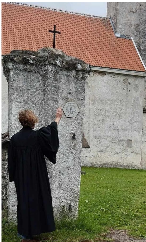
Pirita-Vastseliina kultuuriloolise palverännutee märgi pühitsemine ERAKOGU

ümbritsev avalik ruum - oleks hoitud ja hooldatud, et siin oleks hea olla nii kogudusel kui külalistel. Teine oluline osa on olnud kultuur ja haridus. Kirikute päevad on leidnud oma koha kohalike ja külaliste kalendrites ning Järva-Madise kirikus võis lisaks muusikale kuulda mitmeid väärt loenguid ja ettekandeid.