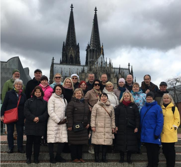
Koguduse esindus külas St Tõnise kogudusel

Üheks eriliseks sündmuseks meie koguduses oli külaskäik 29. veebruarist kuni 04. märtsini St Tõnise sõpruskogudusse Tõnisvorstis Saksamaal, millest võtsid osa Järva-Jaani segakoor ning meie koguduse õpetaja ja nõukogu liikmed.