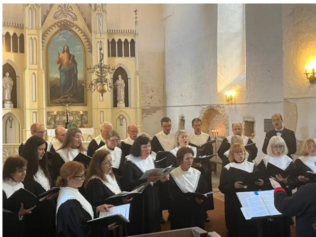
Tallinna Kaarli kiriku kontsertkoor