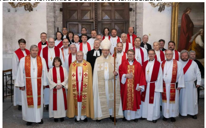
Piiskoplik sinod 31.10.2024 Tallinna Toomkirikus