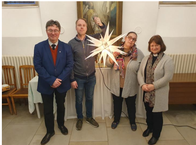
Saksa sõprade poolt kingitud jõulutäht