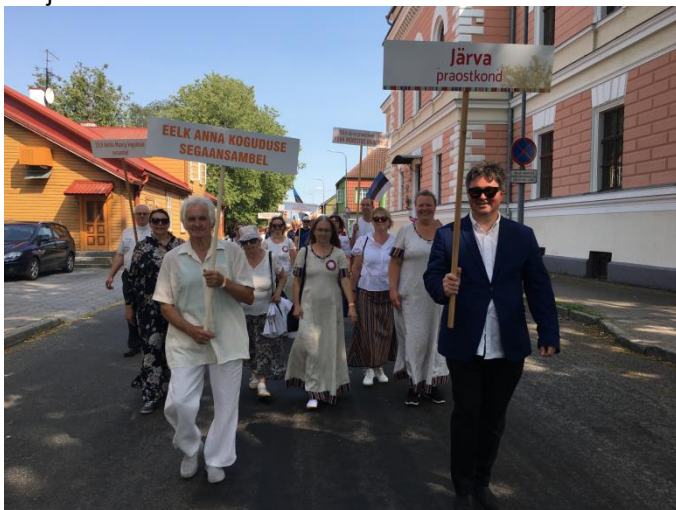
Järva praostkonna inimesed laulupeo rongkäigus