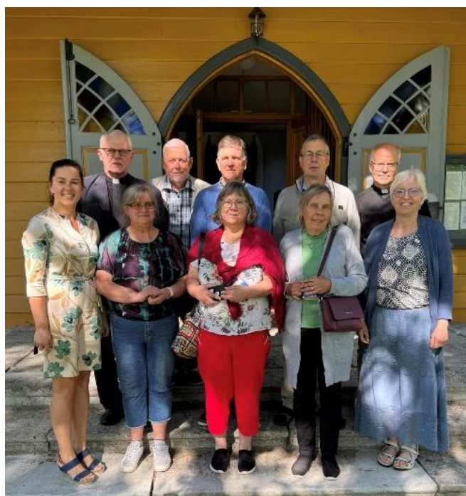
Soomes sõprade esindus Käru kogudusel külas

Eelmisel, 2023. aastal said värskendatud Käru koguduse suhted sõpruskogudusega Soomest, nüüd septembris tuli väike rühm Soomest Nykarleby ja Jepua kogudusest meile vastukülaskäigule. Veetsime üheskoos tore päeva, rääkisime meie sõprus-suhetest ja kinnitasime, et ühte hoidmine ning kogemuste jagamine aitab kirikutel elus püsida. Külastasime koos kohalikke tähelepanuväärseid paiku ja aeg möödus kiirelt heade mõtete seltsis.