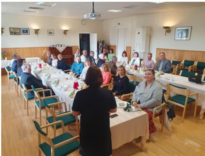
Ülestõusmispühade pidulik õhtusöök