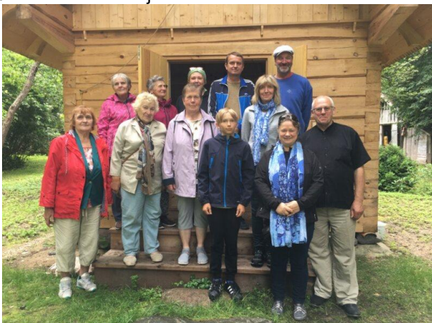
Praostkonna suvise reisi seltskond