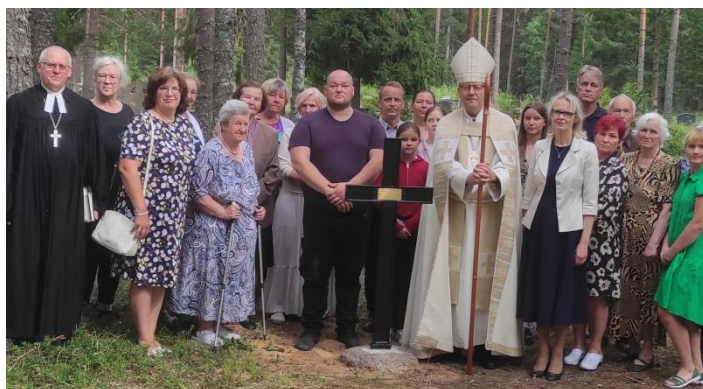
Aegviidu kalmistu pühitsemisest osavõtjad

Meenutuseks sellest kauaoodatud sündmusest tehti ka ülesvõtte.