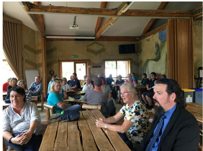
Hofgeismar-Wolfhageni sõpruspraostkonna esindus