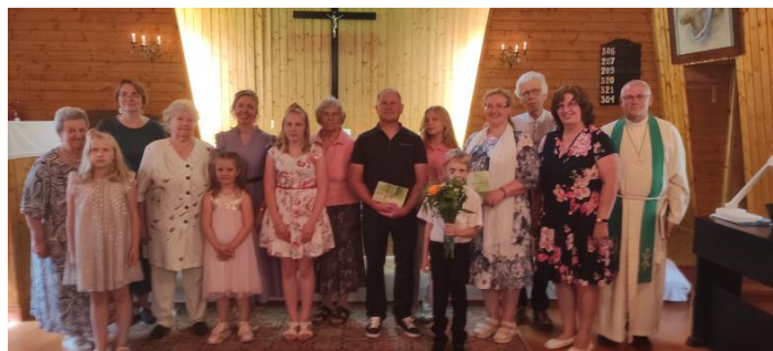
Uku ristimise päev